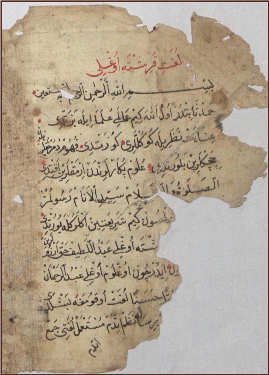
الصفحة الأولى (لغت فرشته اوغلي) لابن فرشته